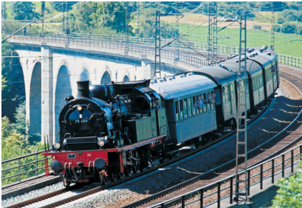
Unter Dampf und Strom: Die Dampflokomotive 78 468 von 1923 fährt über den Viadukt. Auch die Rheingoldlokomotive E 10 1239 kommt am Wochenende nach Altenbeken (unten).