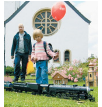
Spannendes Erlebnis: Besuch im Eisenbahnhort Altenbeken.

Jeden Abend erstrahlt der Viadukt in großer Beleuchtung als goldene Brücke. Die Aussichtsplattform oberhalb der Viadukt-Nordseite ist ein Schmuckstück und zieht Wanderfreunde und Eisenbahnfans gleichermaßen an. Vor allem Hobbyfotografen genie-