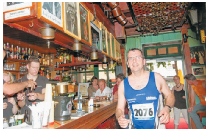
Kein Blick für den Tresen: Der Viadukt-Lauf führt mitten durch die Bahnhofsgaststätte.