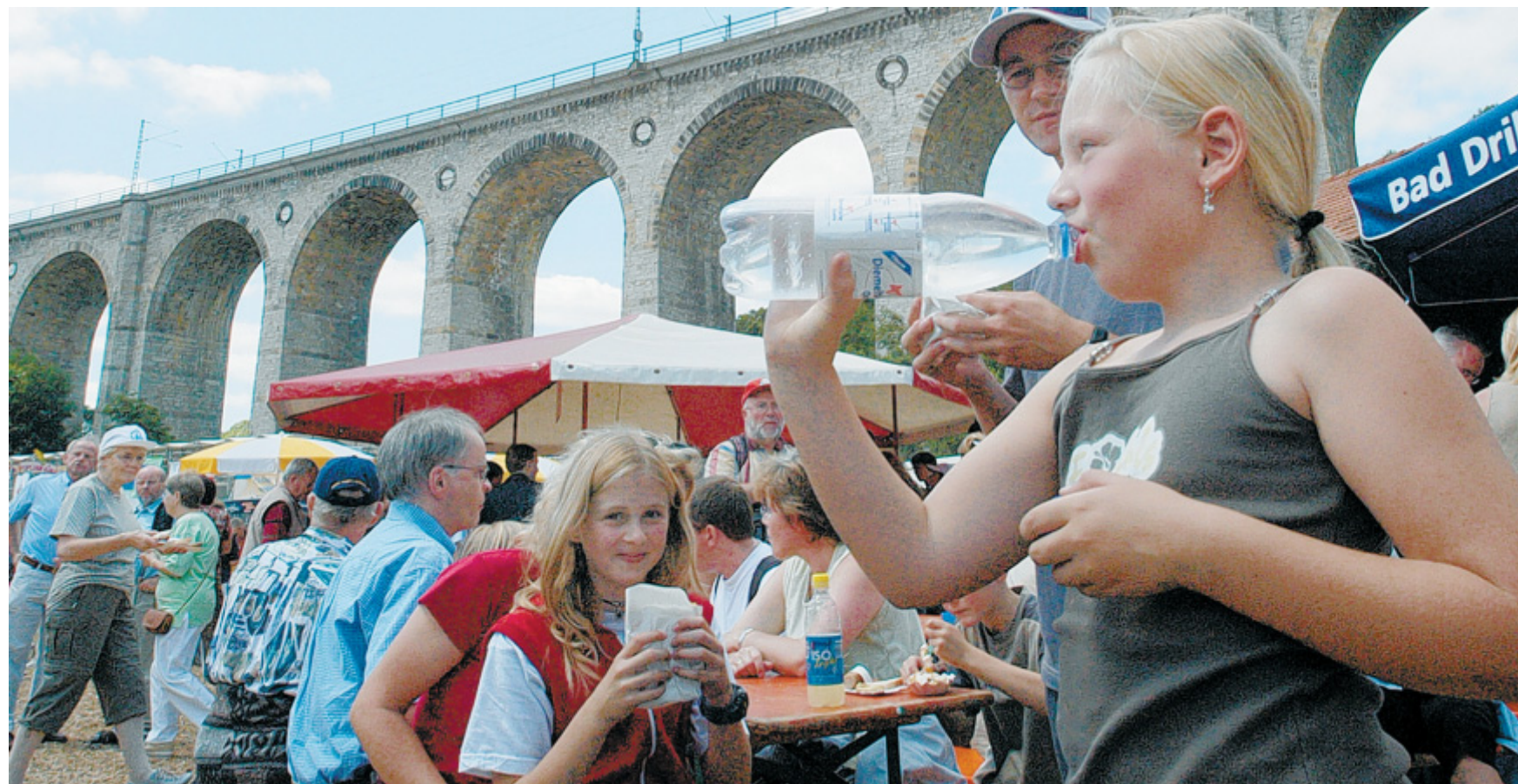
So viele Hingucker machen Durst: Im Schatten des Viaduktes finden Jung und Alt am Wochenende zahlreiche Aktivitäten und Anlaufpunkte.

Welch enormes musikalisches Potenzial in der Eisenbahnergemeinde Altenbeken steckt, lässt sich an der Vielzahl der Musikvereine erkennen. Im Laufe des Sonntags präsentieren sich das Bundesschützen Garde Musikkorps Schwaney, die Garde Grenadiere, der Spielmannszug Königin Kürassiere, das Jugendblasorchester Egge, der Eisenbahn Männergesangverein, Arte Musica, der Frauenchor Taktvoll und der Katholische Kirchenchor mit Konzerten auf der Open-Air-Bühne am Bahnhofsvorplatz. Vivat Viadukt findet seinen glanzvollen Abschluss mit einem Konzert.