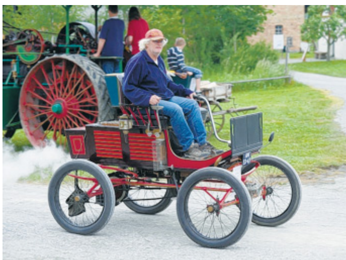
Unter Dampf: Auch ohne Schiene ziehen diese Nostalgie-Fahrzeuge die Blicke der Besucher auf sich.